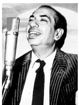
अदा किया था। वाक्यों में हुआ था शूट : हमराज का एक रोमांटिक सॉन्ग तुम अगर साथ देखे का वादा करो... आज भी हर किसी का फेवरेट बना जाता है। सुनील दत्त और अभिनेत्री विमी पर फिल्माया गया ये पॉपुलर

नई दिल्ली। मोहम्मद रफी और किशोर कुमार की तरह महेंद्र कपूर भी हिंदी सिनेमा के दिग्गज गायकों की फेहरिस्त में शामिल रहे। उन्होंने अपने कैरियर में एक से बढ़कर गीतों के जरिए सिनेप्रेमियों के दिलों को सुकून पहुंचाया। आज हम आपको महेंद्र कपूर द्वारा गाए गए 58 साल पुराने एक ऐसे गाने के बारे में बताते जा रहे हैं, जो रोमांटिक सॉन्ग की तर्ज पर हर किसी का फेवरेट बना जाता है। गाने के बोल ऐसे हैं, अगर आपको रूठी हुई प्रेमिका सुन ले तो झट से मान जाए। इस गीत को अभिनेता सुनील दत्त पर फिल्माया गया था।